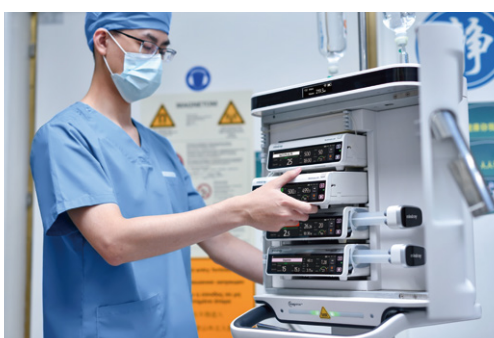
Free combination of four channels