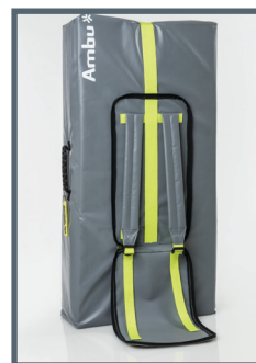
Přepravní brašna (vč. cvičné podložky)