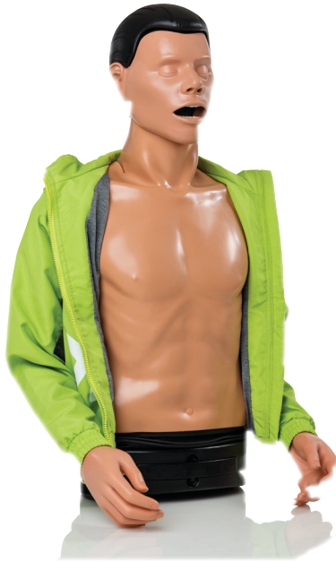
Paže a nohy jsou volitelně dostupné