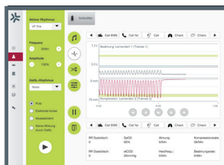
Modul Ambu Manikin Management