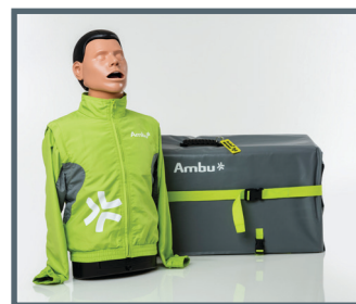
Torzo Ambu Man Airway